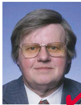
очень затемненные стекла на стеклах – вспышка