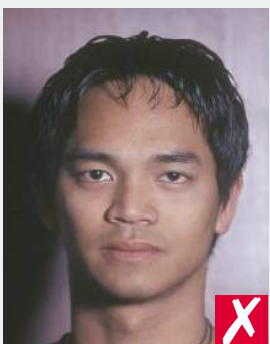
тень за головой