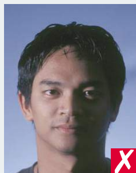
тень на лице