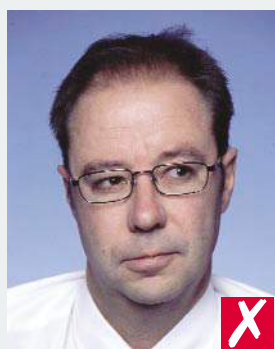
взгляд в сторону